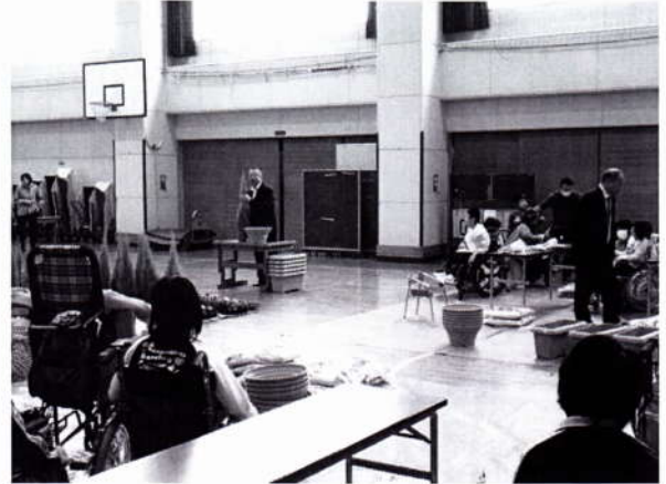
植栽についての説明を聞きます