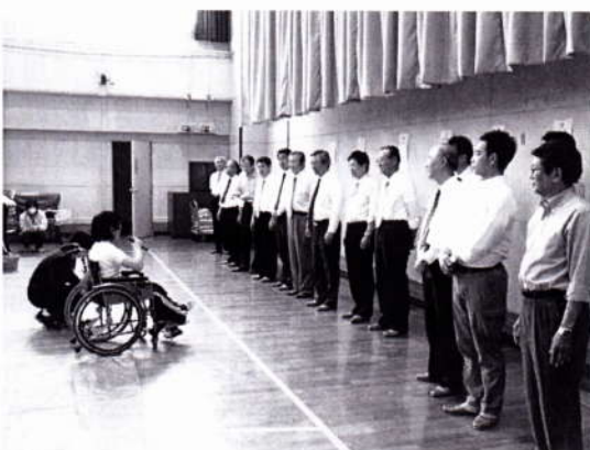
生徒代表からお礼の言葉