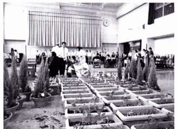
たくさんのプランターが完成