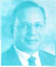
RI会長 K.R. "ラビ" ラビンドラン