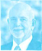
RI会長 ラリー・ラシン