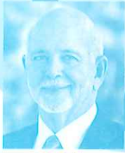
RI会長 ラリー・ラシン