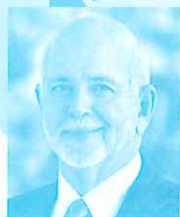
RI会長 ラリー・ラシン