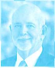
RI会長 ラリー・ラシン