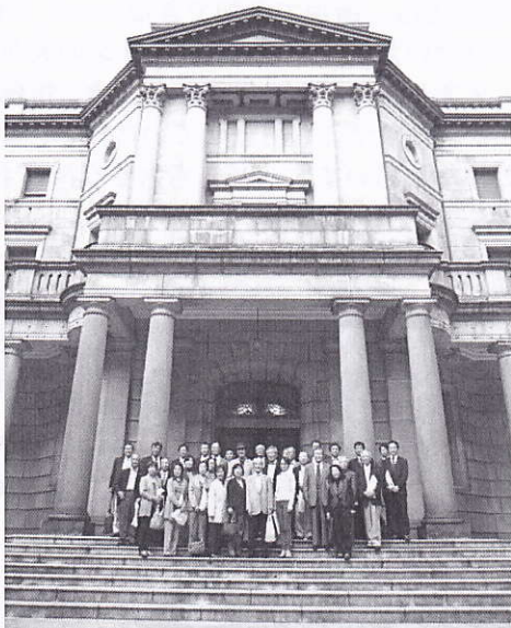
日銀本館をバックに撮影