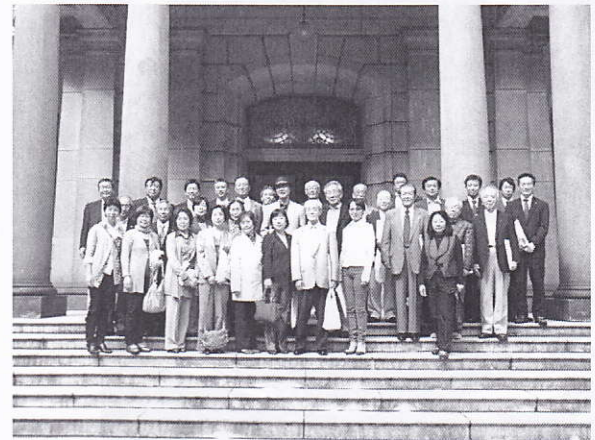
日銀本館中庭での記念写真

視察はまず待合所でカメラや携帯電話など持ち込み禁止のものをロッカーに預け、金属探知機のゲートを通して、プレゼンルームに入り、日本銀行の概要や役割の説明を受けました。その後、新館営業場や本館の旧地下金庫、本館史料展示室、廊下に飾ってあった 7 名の歴代総裁の肖像画などを見学。重厚な雰囲気の中での見学でした。