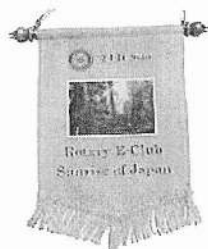
E-Club Sunrise ハナー