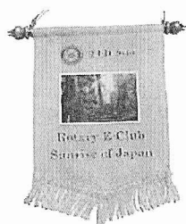
E-Club Sunrise バナー