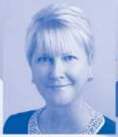
RI会長 ジェニファー・ジョーンズ