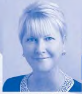
RI会長 ジェニファー・ジョーンズ